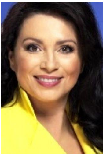
Jana Bobošíková (Suverenita)

Ing. Jana Bobošíková, kandidátka na prezidentku ČR za Suverenitu pro volby 2013 (oficiální kandidaturu na post oznámila 29.9. 2012)