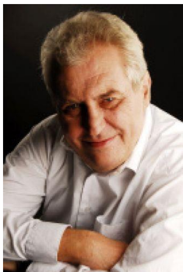
Miloš Zeman (SPOZ)

Ing. Miloš Zeman, CSc., kandidát na prezidenta České republiky za SPOZ pro volby 2013 (oficiální kandidaturu na post prezidenta ČR oznámil 26. 6. 2012)