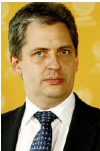
Jiří Dienstbier (ČSSD)

Prof. JUDr. Vladimír Franz, kandidát na prezidenta České republiky (oficiální kandidaturu na post prezidenta oznámil 2.8. 2012)