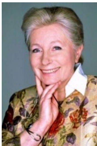
Zuzana Roithová (KDU-ČSL)

MUDr. Zuzana Roithová, MBA, kandidátka na prezidentku České republiky za KDU-ČSL pro volby 2013 (oficiální kandidaturu na prezidentský post oznámila 4.10. 2012)