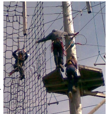
Lanové centrum Žihle

Na škole v přírodě jsem letos byla podruhé a moc se mi tam líbilo. Doufám, že budu moci jet i další rok!