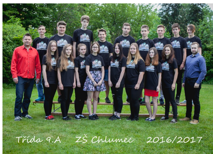
Třída 9.A ZŠ Chlumec 2016/2017