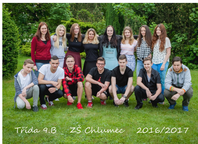
Třída 9.B ZŠ Chlumec 2016/2017