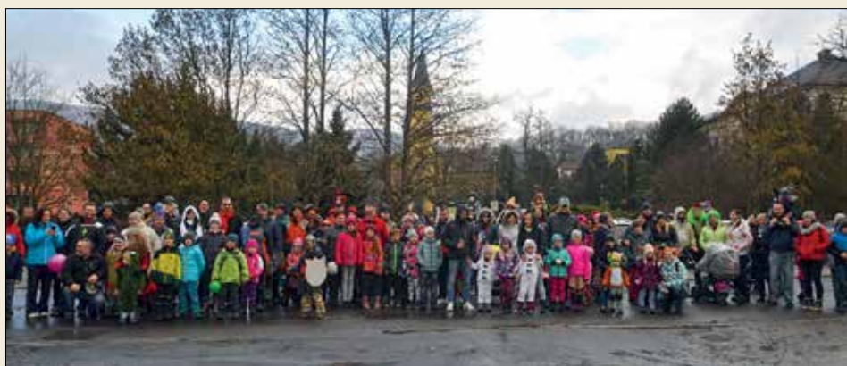
X. Chlumecký Masopust se tradičně vydal od hasičárny přes celý Chlumeč a zpět na zabijačkové hody.