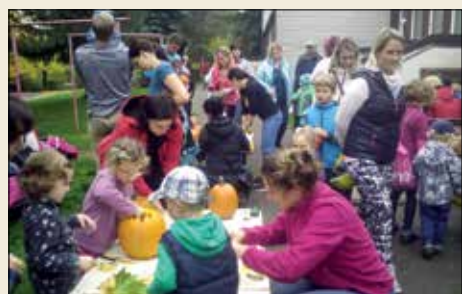
Dýňová strašidla na zahradě MŠ

Začátkem prosince se těšily z Mikulášské nadílky a pak se poctivě připravovaly na Vánoční svátky. Trénovaly básničky, písničky a koledy