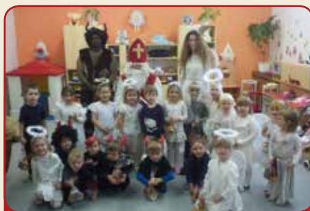
NAŠE ŠKOLKY /4