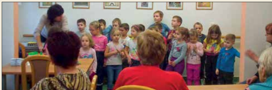
Vánoční besídka v Domě s pečovatelskou službou

na besídku v MŠ a také babičkám pro potěšení v DPS. Zde zhlédly výstavu jejich prací a společně s nimi si vyrobily vánoční hvězdy. V domově důchodců si domluvily další návštěvu ke dni „žen a matek“.