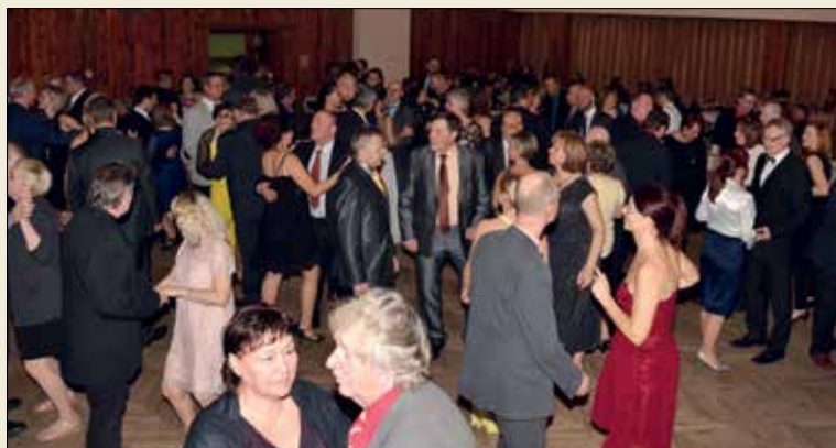
6. Ples města s bohatou tombolou a plným parketem.