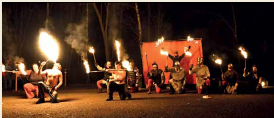
Vzpomínková akce bitvy českých knížat v r. 1126, ohňovou show a ohňostroj předvedly šermířské spolky.