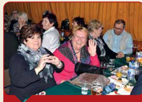
SENIOŘI SE BAVÍ